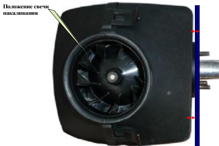
б) При установке на вертикальную поверхность

5.2. дополнительно проверить после установки: вращается ли крыльчатка вентилятора без помех и наличие зазора между рёбрами теплообменника и кожухом отопителя: