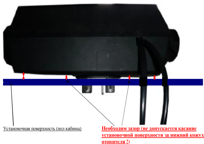
а) При напольной установке

5.1 Обязательно необходим зазор (минимум 10 мм) между отопительным прибором и полом автомобиля: